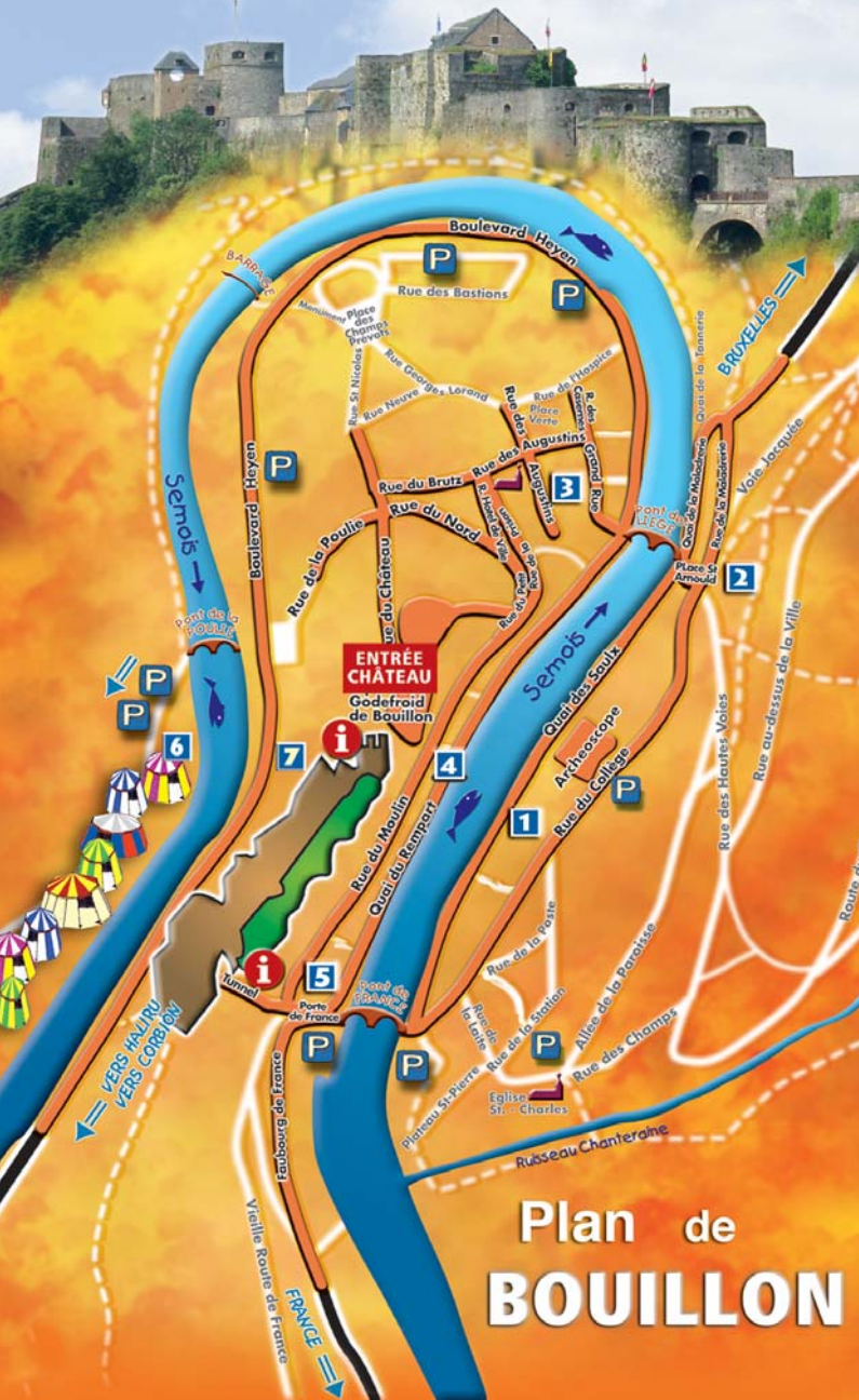
Plan de BOUILLON